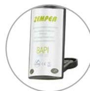
Stand voor handsfree gebruik op een vlakke ondergrond Support pour utilisation mains libres sur une surface plane