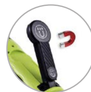
Magneet voor metallix oppervlaktebevestiging Aimant pour la fixation de surface metallix