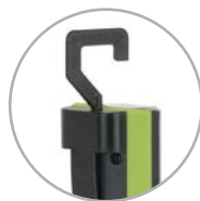
Multipositionele haak Crochet multipositionnel