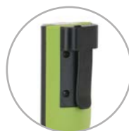
Riem clip Boucle de ceinture