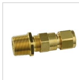
PSA001 PRESSE ETOUPE SATURNO