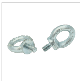
CAM001 BOULON A CEIL SATURNO POUR FIXATION SUSPENDUE