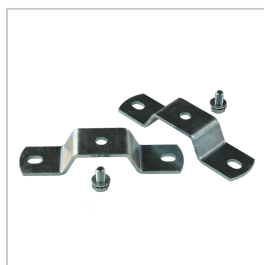
BRD001 BRIDE DE FIXATION SATURNO LOT DE 2