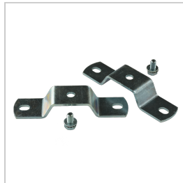
BRD001 BRIDE DE FIXATION SATURNO LOT DE 2