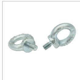
CAM001 BOULON A CEIL SATURNO POUR FIXATION SUSPENDUE