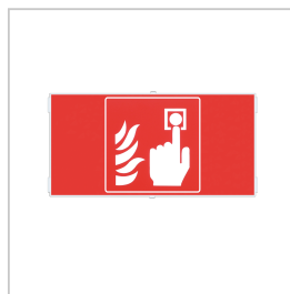
APH030 PICT. HARENA RODE DRUKKNOP