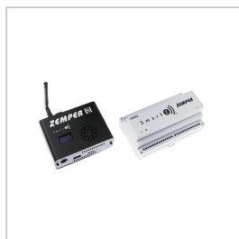
CSZ003 SMARTZ CENTRAAL+ USV CSZ002+SAI002