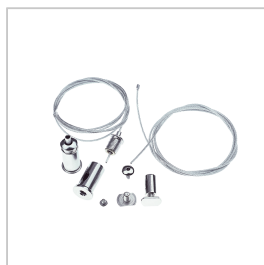
AKS200 ACC. KONS OPHANGACCESSOIRE