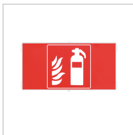
APH022 PICT. HARENA RODE BRANDBLUSSER