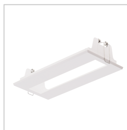
AMY0011 ACC. VER. ALYA WIT