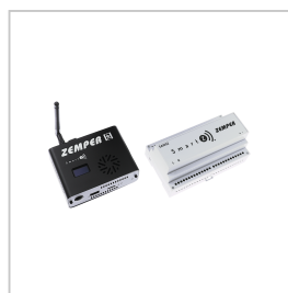
CSZ003 SMARTZ CENTRAAL+ USV CSZ002+SAI002