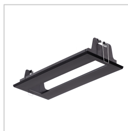
AMY0011N ACC. VER. ALYA ZWART