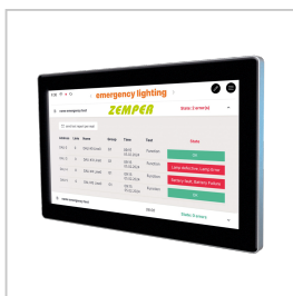
ZWEBDALI2 CENTRAL DALI2