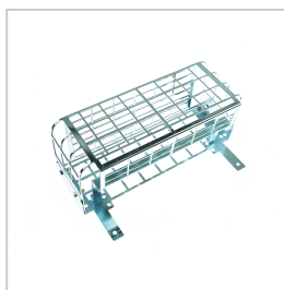
AGM160 ACC. BESCHERMKORF MAXILUM EVO