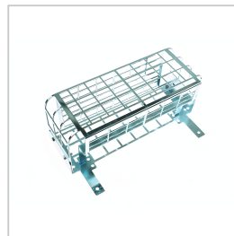
AGM160 ACC. BESCHERMKORF MAXILUM EVO