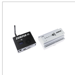
CSZ003 SMARTZ CENTRAAL+ USV CSZ002+SAI002