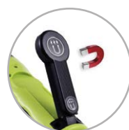
Aimant pour fixation sur surface métallique