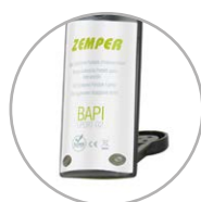
Support pour utilisation mains libres sur surface plane