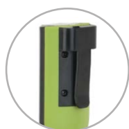
Clip de ceinture