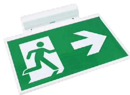
Montage au plafond